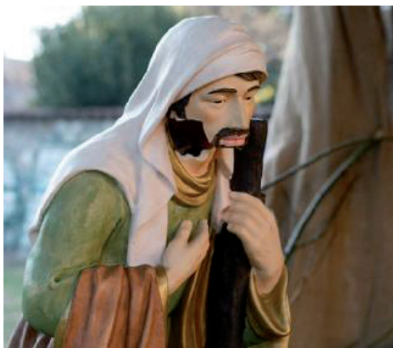
San Giuseppe ha perso una parte del volto

Se individuati, rischiano una denuncia per danneggiamento e nulla più. Tornerebbero liberi una volta firmato il verbale in caserma. ♦