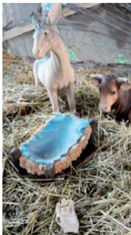
Una mano e la mangiatoia vuota